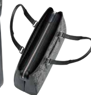
No.8309 手提げ 24×35×12cm

口前はマグネット付きファスナーで両アオリポケットと内側にオープンポケットが1つ。背胴にポケット1つ。内にファスナーポケット1つとオープンポケット2つ。ペットボトルポケット1つ。