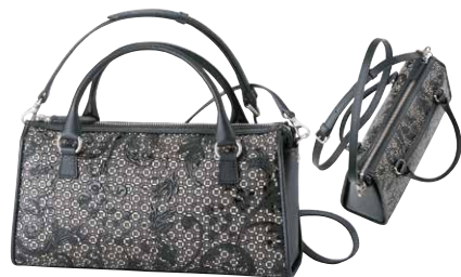
No.8306 手提げ 16×29×9.5cm

税込 84,700円 (本体価格 77,000円) ※在庫がなくなり次第、販売終了となります。