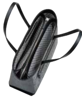
No.8304 セミショルダー 25.5×38×13cm

口前はファスナーで両アオリポケットと内側にオープンポケットが1つ。背胴にファスナーポケット1つ。内にファスナーポケット1つとオープンポケット2つ。ペットボトルポケット1つ。