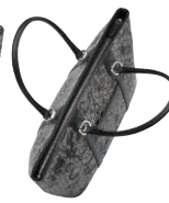
No.8308 手提げ 21×39.5×13cm

口前はファスナーです。背胴にポケット1つ。内にファスナーポケット1つとオープンポケット2つ。